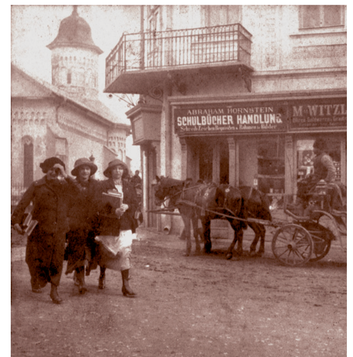
Imagine din Suceava la începutul sec. XX.