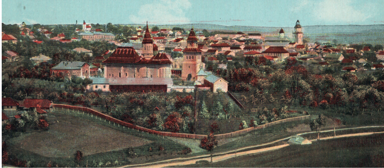
Suceava în anul 1906 (partea din sud-vest).

Populația. Minoritățile etnice. În perioada 1775-1918, Bucovina a devenit un creuzet etnic și cultural, în care au trăit 8 etnii ce au profesat 11 credințe religioase. În 1775, populația românească predomina în mod absolut în Bucovina