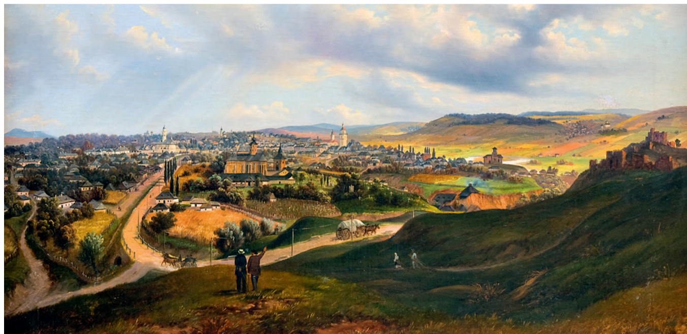
Franz Xavier Knapp – Suceava la 1859, ulei pe pânză.

Numele Bucovina provine din cuvântul slav „buk” (fag), preluat în limba germană sub forma Buchenland („Țara Fagilor”) sau Bukowina. Ca entitate statală distinctă, Bucovina nu există decât din 1775, odată cu intrarea părții de nord-vest a Moldovei în componența Imperiului Habsburgic (Austriac), formând o provincie cu o suprafață de 10.442 km 2 (aproximativ a 60-a parte din suprafața Imperiului).