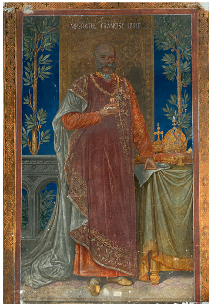
Biserica „Sf. Gheorghe” (Mirăuți) din Suceava – Împăratul Francisc Iosif I, a domnit între 1848-1916.

Scurt Istoric. În Evul Mediu, după 1359, zona denumită după 1775 Bucovina a fost nucleul de formare al statului feudal Moldova, unde s-a desfășurat o viață spirituală activă, concentrată în jurul unor mănăstiri celebre (Putna, Moldovița, Sucevița,