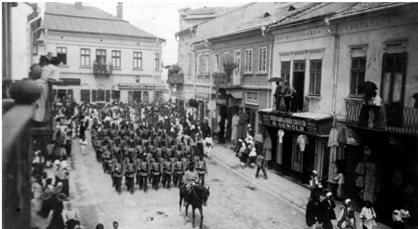
Defilare militară pe Hauptstraße din Suceava.

Aceste valori bucovinene din trecut, sunt cu adevărat valori europene în prezent și în viitor.